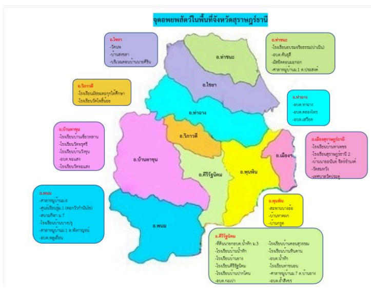
แผนที่จุดอพยพสัตว์ ประจำปี พ.ศ. ๒๕๖๘