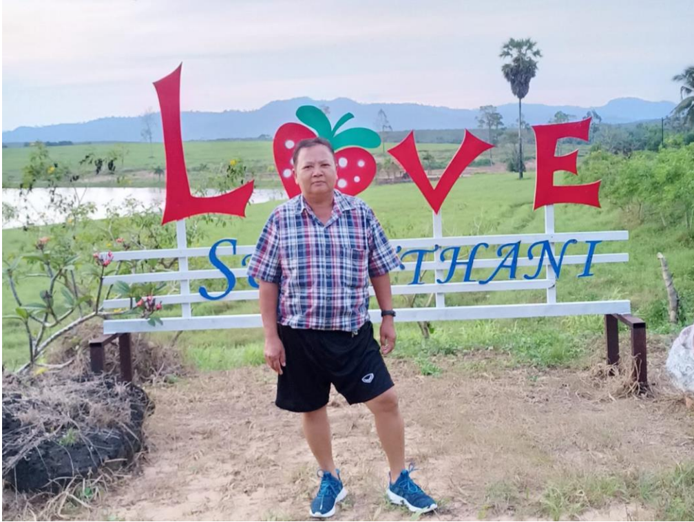
๓. มีสถานที่ให้ประชาชนได้พักผ่อนเป็นศาลาริมน้ำ